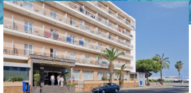
Außenansicht des Hotels

Wer All inclusive bucht, profitiert von unserem Special! Schon bei der Ankunft im Hotel, könnt ihr euch ab 09:00 Uhr an den Snacks und Getränken bedienen, auch wenn ihr noch nicht einchecken konntet. Genau dasselbe gilt am Abreisetag: Für euch geht's erst abends zurück, musstet aber schon morgens auschecken? Kein Problem! Genießt auch noch bis zur Abreise das Angebot an Snacks und Getränken.