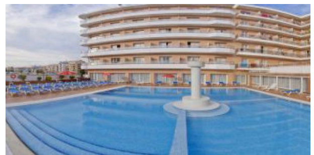
Der große Poolbereich des Hotels