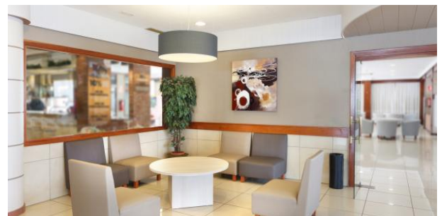
Entspannt in der stylischen Sitzecke!