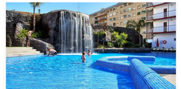
Der großzügige Poolbereich