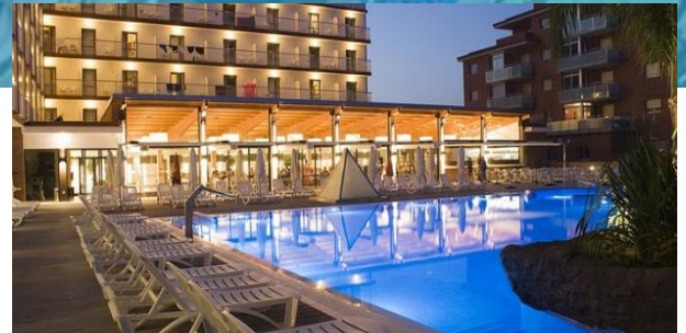
Der wunderschöne Außenbereich mit Pool

In den Morgen- und Abendstunden erwartet euch im Restaurant ein leckeres Buffet mit mediterranen und internationalen Köstlichkeiten. Gegen einen geringen Aufschlag habt ihr auch die Möglichkeit, die Vollpension zu buchen, um zusätzlich auch noch mittags ordentlich schlemmen zu können. Bei der großen Auswahl am Buffet ist mit Sicherheit für jeden etwas dabei! Beim Show Cooking könnt ihr zusehen, wie die Speisen direkt vor euren Augen frisch zubereitet werden. Zudem finden regelmäßig Themenabende statt.