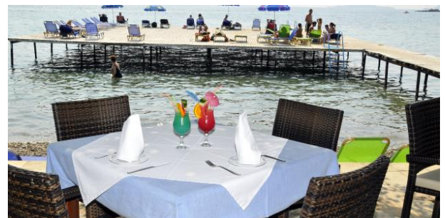
direkt am Strand