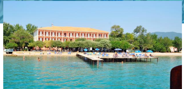
direkt am Strand

Ein reichhaltiges Frühstück ist die Standardverpflegung im Hotel, damit ihr gut gestärkt in den Tag starten könnt. Wer möchte, kann aber auch gerne die Halbpension hinzu buchen und kommt damit in Genuss eines zusätzlichen Abendessens.