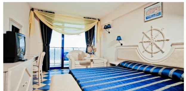
Hotelzimmer mit Balkon