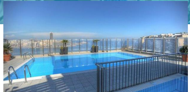
Plaza Regency Hotel Rooftop Pool

Lasst euch am reichhaltigen Frühstücksbuffet verwöhnen und startet gut gesättigt in den Tag. Wer sich auch gerne abends am warmen Buffet bedienen möchte, bucht einfach die Halbpension hinzu. Hier ist sicher für jeden was dabei!