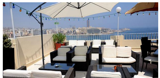
Plaza Regency Hotel Dachterrasse